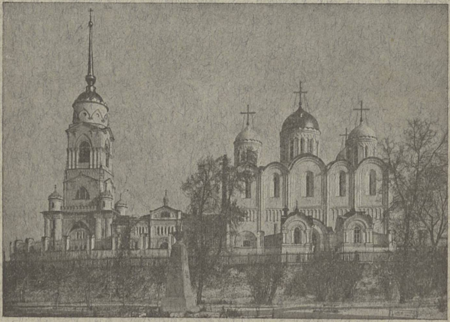
Губ. г. Владиміръ. СКОРОПЕЧАТНЯ И. КОИЛЬ.