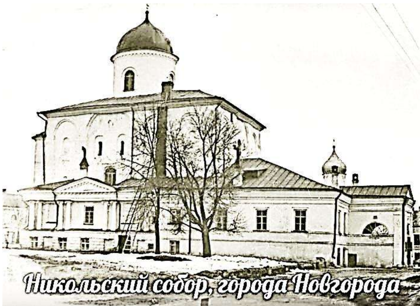
Никольский собор, города Новгорода