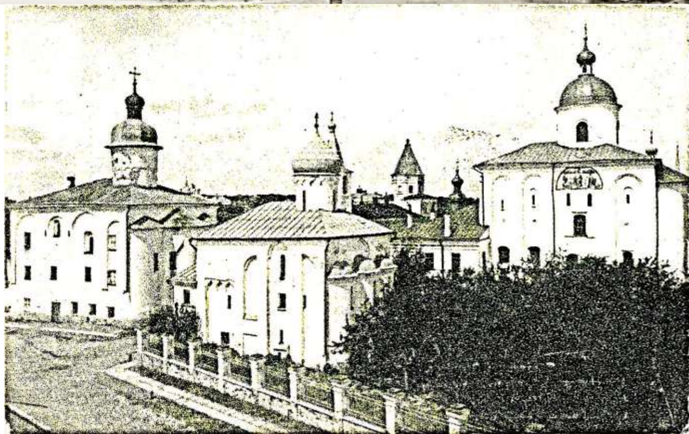
Новгород. Ярославово Дворище. Церкви: жен Мироносиц (1510), Прокопия мученика (1529 г.) и Никольский собор (1113 г.) с юго-восточной стороны.

Автор фотографии фото-тинто-гравюра Т-ва «Образование». Издание Новгородского «Общества Любителей Древности». Время создания: 1905-1917 гг. Собрание открыток ЦАК.