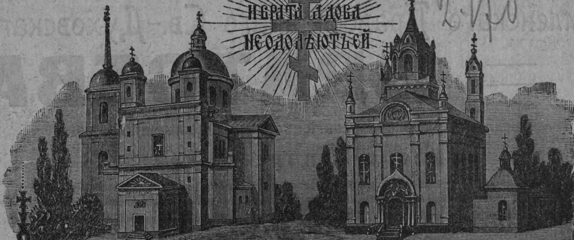
ХР. СВ. ДУХА