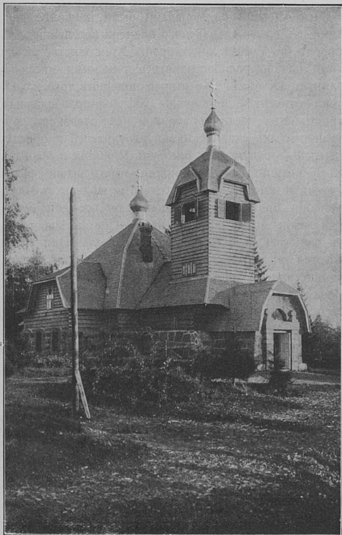
Наружный видъ монастырскаго храма.

домъ прежде служилъ квартирою для монастырскаго священника и діакона. Нынѣ въ немъ живетъ нѣкій священникъ со своею семьею, лишившійся, по болѣзни, возможности служить въ приходѣ. Подымаясь далѣе по дорогѣ, придется пройти мимо зданія хлѣбной. Съ этого мѣста дорога идетъ среди стройныхъ тополей и елей, засаженныхъ тутъ по обѣимъ сторонамъ дороги. Поднявшись немного, дорога сворачиваетъ направо и выходитъ на поляну. Здѣсь справа помѣстился монастырскій храмъ изъ дикаго камня съ деревянной надстройкой. За храмомъ слѣдуетъ небольшое незастроенное мѣсто. Лѣтомъ тутъ разбитъ цвѣтникъ. Далѣе слѣдуетъ двухъ-этажный деревянный корпусъ; въ немъ устроены трапезная съ кухней, келліи для матушки игуменіи и нѣкоторыхъ сестеръ, а за нимъ слѣдуютъ два одноэтажныхъ деревянныхъ корпуса съ келліями для сестеръ, и одно деревянное зданіе, въ коемъ помѣщается служитель алтаря. Всѣ эти зданія расположились какъ-бы полукругомъ, имѣя передъ собою поляну, которая лѣтомъ служитъ мѣстомъ для посадки огородныхъ овощей. За этой поляной