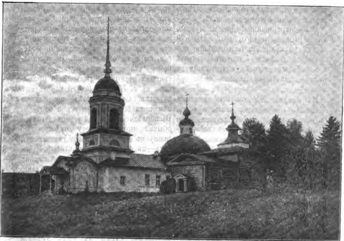
Видъ Покровскаго Глушицкаго монастыря.

что левкасъ сдѣланъ не прямо на доскѣ, а сначала наложена на нее паволока, которая крѣпче принимаетъ на себя левкасъ и удерживаетъ его весьма долго и такимъ образомъ надолго сохраняетъ иконное писаніе. Паволока изготовлялась изъ рѣдкой холстины. Пропитанная клеевымъ отваромъ ткань налагалась на доску ровно, безъ сгибовъ. На паволоку налагается алеба-