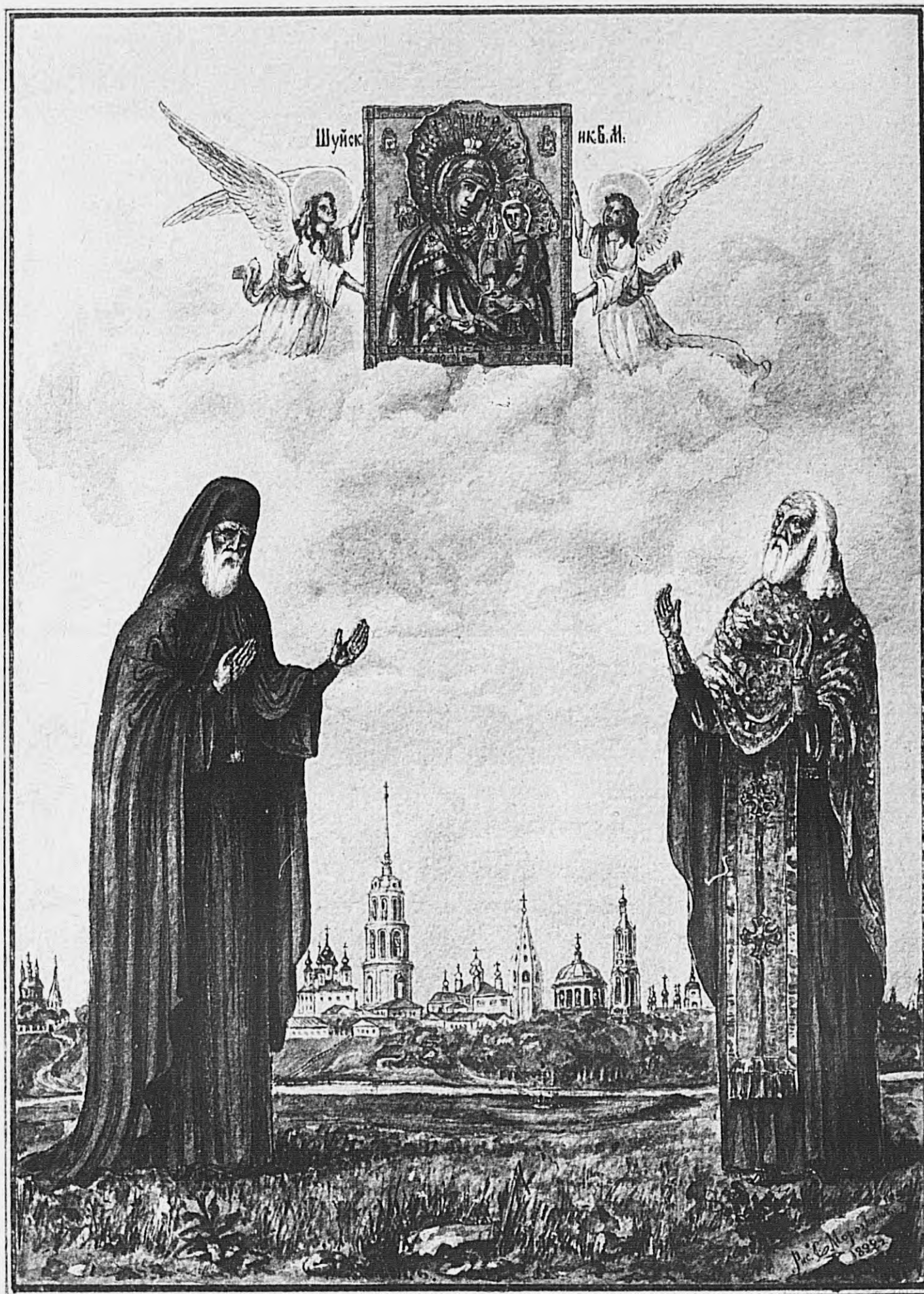
Шуйскіе неканонизованныя святые: Исаакій затворникъ Николо-Шартромскій и Григорій іерей Кітоискій.