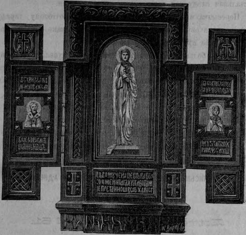
Изъ Мотивовъ Русской Архитектуры.