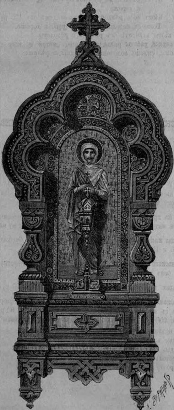
Изъ Мотивовъ Русской Архитектуры.