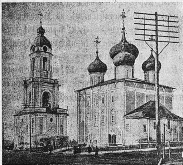
Тверской кафедральный соборъ.