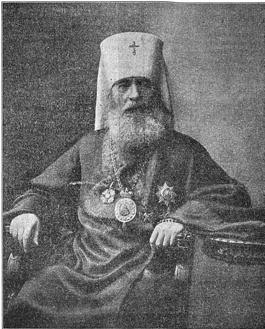
† Высокопреосвященнѣйшій Антоній, Митрополитъ С.-Петербургскій.

ный на свѣщницѣ Русской Православной Церкви, почившій святитель дѣйствительно горѣлъ и свѣтилъ, сіяя своимъ душевнымъ обликомъ далеко и за предѣлы нашего Отечества.