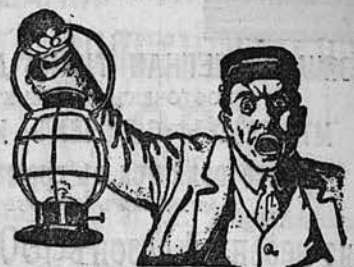
Тов. знак. утв. грам.

ЛИШАИ, СЫПЬ, ЯЗВЫ, ПРЫЩИ, ОЖОГИ и т. д. Зудъ и боль проходятъ почти моментально. Цена 1 руб. 50 коп. С. РОСТЕНЪ, Казанская ул., № 26, С. Петербургъ. Противъ недостатковъ кожи. Кусокъ 75 коп., 1/2 дюж. 4 руб. и гигиеническая пудра ЛАИН-РОСТЕН кор. 1 руб. По посылка налож. платежомъ по почтовому тарифу