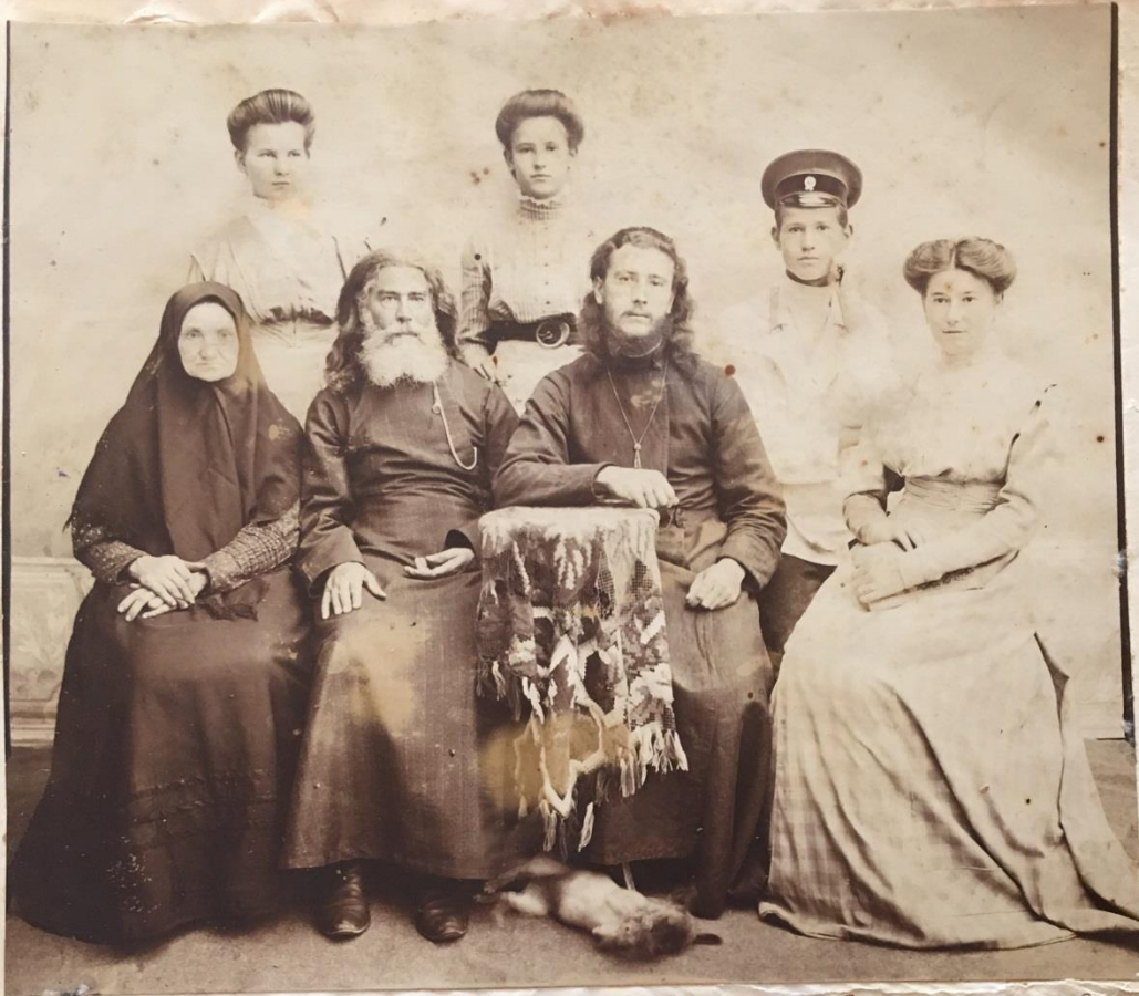
Родная семья (снимок, сделанный ранее первого)