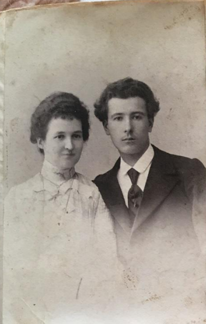
Венчикова и невесты в 1903 году

милым родителям. и, конечно, мать. Судиманное через Знаменскую предложение было принято, а 12 го Февраля 1903г., в Среда на Масанну, в г. Сентимеь состоялось наше обручение и мы были объявлены венчиком и невестой. Свадьба наша состоялась вскоре после нашего семинарского выпуска, а именно 30 го июня, когда я уже, как студент семинарии, был назначен на диаконские места в с. Кувакино, Алтайского уезда и 6 го июля 1903г. был рукоположен в сан диакона, а недолгим пере- одом мы с молодой женой отправились на новое место своего служения и жительства, которое к тому же было мне знакомо и раньше, так как находилось в 4-5 верстах от Сутяжинца и почти в таком же расстоянии от с. Клад- ышир, где в то время жили мои родители Ригдов, мы сами не в лучшей и неудачливой кра-