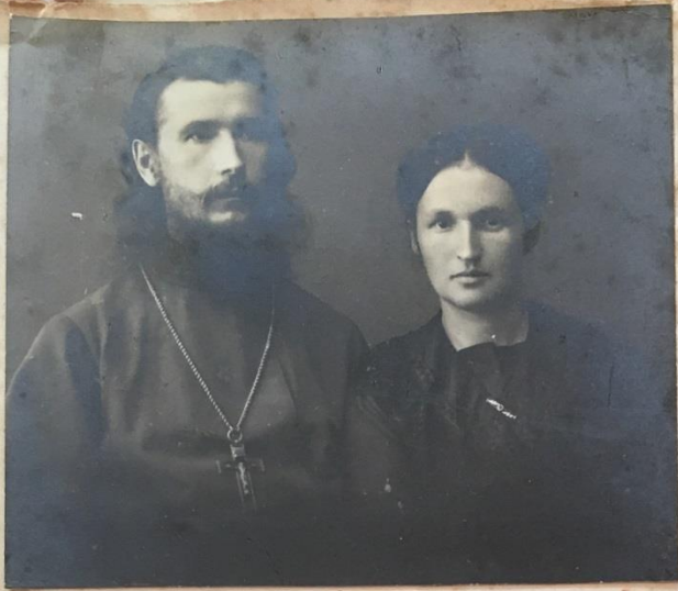
Снимок 1915 года, сделанный во время болезни, пред операцией.

Прошел год после моей операции, в течение которой я более недо- люгал, чем чувствовал себя здоровым и Господь снова посетил нас испытанием: в конце Октября 1916. серьезно и опасно заболела жена. Сначала она разрешилась мертвым ребенком, а затем полу-