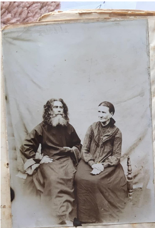
Мой отец и моя мать

Вообще трудно перечислить все детские радости и тя- готы, какими дарима наша жизнь в теплом родительском гнезде, под крылом нежной ма- муси матери и поощ- рительной лаской доброго отца. Незаметно, как во- сне, пролетели первые детские годы и настала пора школьного учения, которая ограничила время