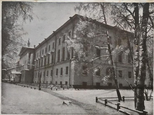
Зданіе Академіи въ Александрo-Невской лаврѣ.

Какъ ни слабы были мои одица познанія для такого серьезнаго экзамена, каковы были тогда вступительный - во вѣтъ Академіи, - я рѣшился попытаться счастья и въ срединѣ Августа 1908 г. потянулся въ Петербургъ. Сначала было дано три письменныхъ экзамена: 1, по психологіи: „Значеніе самопознанія въ дѣль нравственнаго самосозданія челоука“, 2, по сравнительному богословію: „Поманіе о Церкви по Православнаму, Лютеранскому и Римско-католическому ученію“ и 3, поученіе на текстъ: „Блаженніи множетивыи...“ Сверхъ моего ожиданія, сотиненія мои вошли у меня прекрасно. По психологіи мое сотиненіе было оцѣнено баломъ 4,75; по богословію: 4; и поученіе - 4-. Это меня обоурило.