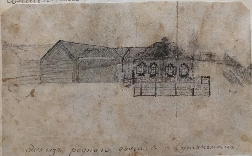
Закізь родного дома, а в Сутяжинѣ.

вело (по крайній мірті нїякогогого изъ насъ) къ сознатель- ному приготвленію и на то поприще, куда вела насъ Семінарія и къ добровольному избранію того пути, ко- торий ввєгда рисовали моему юношескому вообра- женію и неопредєлено звали мене къ себѣ всего смиро смирнѣ , всємъ великімъ своего идеала. Къ Концу Семінаріи я окопательо и безповоротнѣ рѣшилъ посвятить себѣ служенію въ деревнѣ въ скромномъ званіи сельскаго священника.