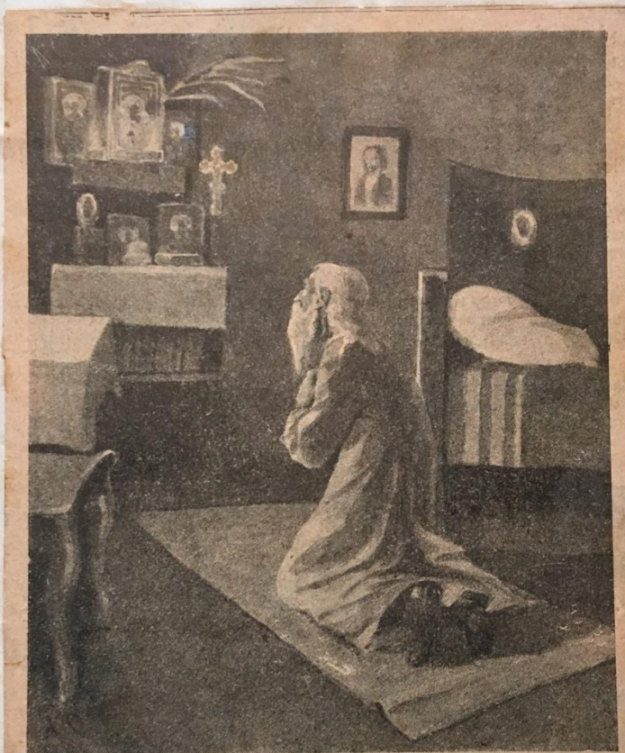
„Да будет воля Твоя“...—Изъ иллюстрац. „Р. Паломника“.