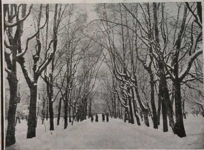
Вѣковая липовая аллея, насаженная въ первые годы основанія Академіи.

юношей студентами, — все это пронеслось и скрылось отъ меня какъ въ какомъ-то вальсе номъ ентъ. Но зато сцена, которую я пережилъ въ новомъ Карменскомъ храмѣ, была повороч- нымъ пунктомъ моего пестерства, когда я убождая и толкая Бодий сказалъ мнѣ, что я долженъ принадлежать простому народу и „за- сласливую долю народную жизнь всего до капли отдать“.