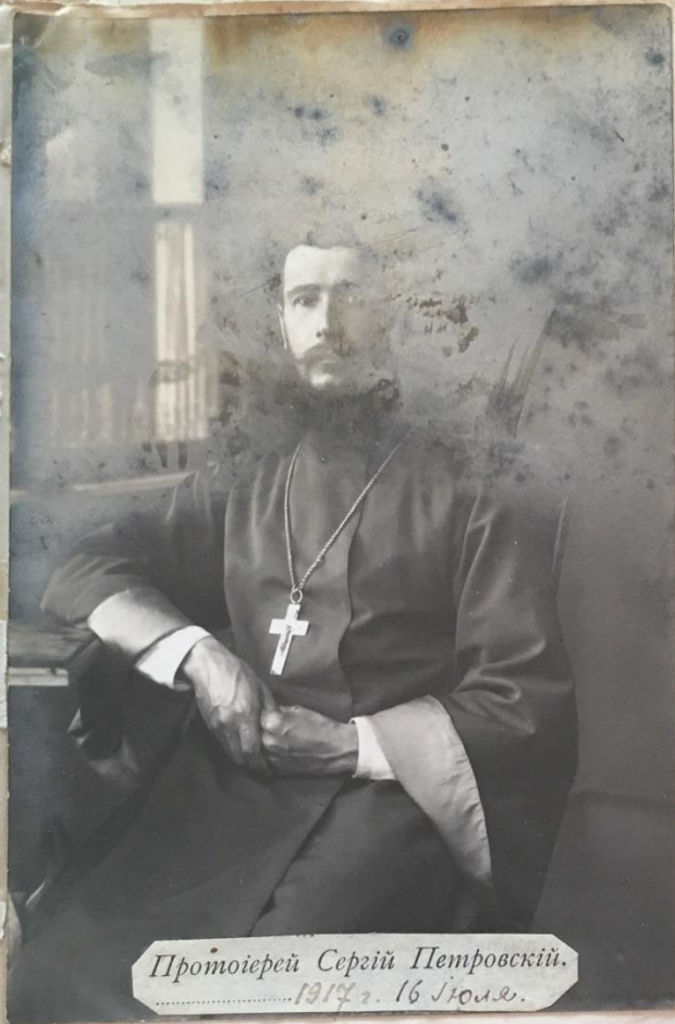
Протоіерей Сергій Петровскій. 1917 г. 16 июля.

Итак, в 1917 году, на четырнадцатом году своего священства и на 36-м году своей жизни, — я уже протоіерей! Это такая честь, такая высота, отъ которой можно было почувство- вать головокруженіе. Но не такъ я смотрѣлъ на все эти высокія и неизгладимыя для меня отличія. Всяки разъ они меня путали, заставляли скорбѣть и еще болѣе сознавать