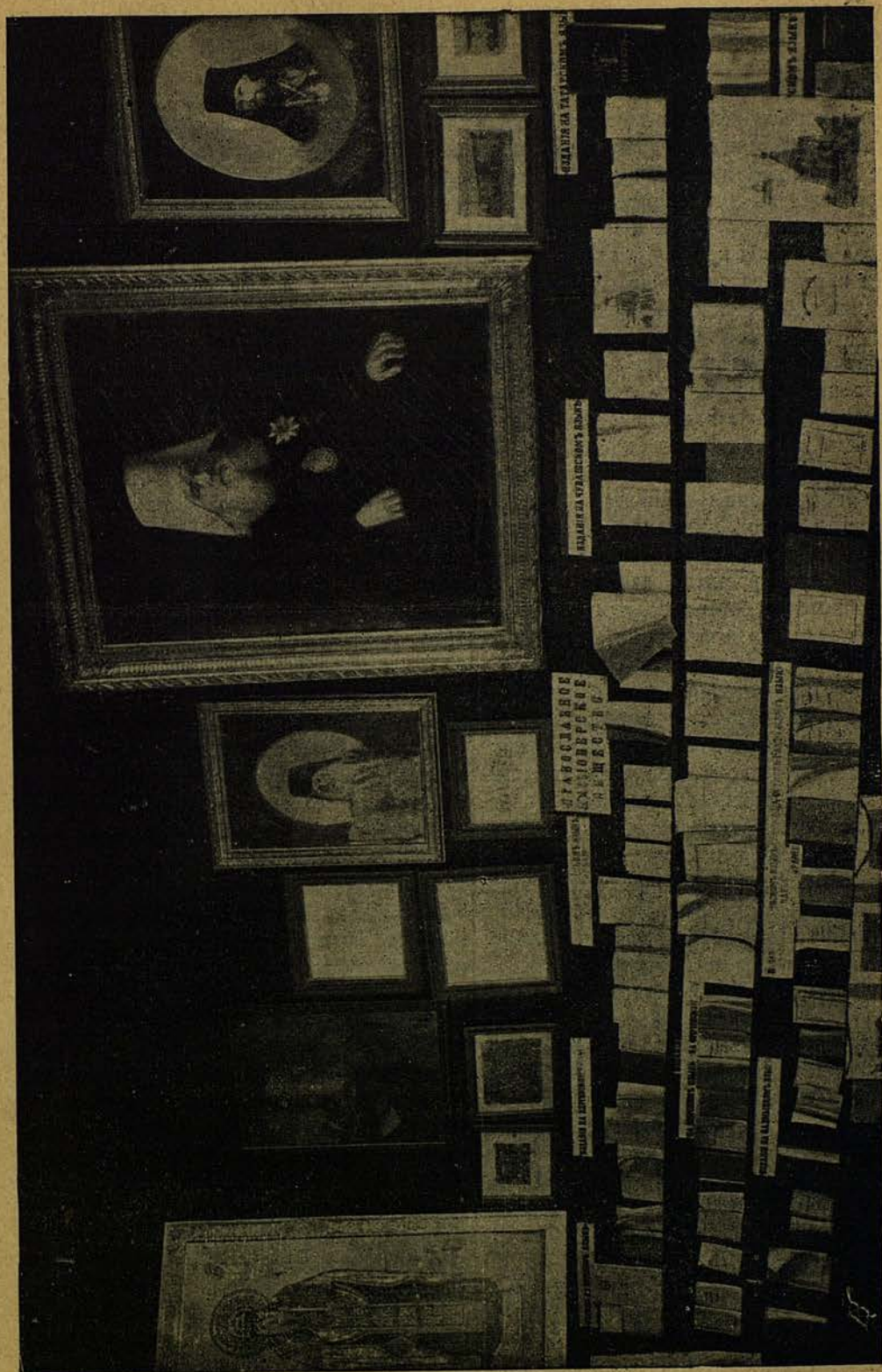
Миссіонерскій отдѣлъ: миссія инородческая.