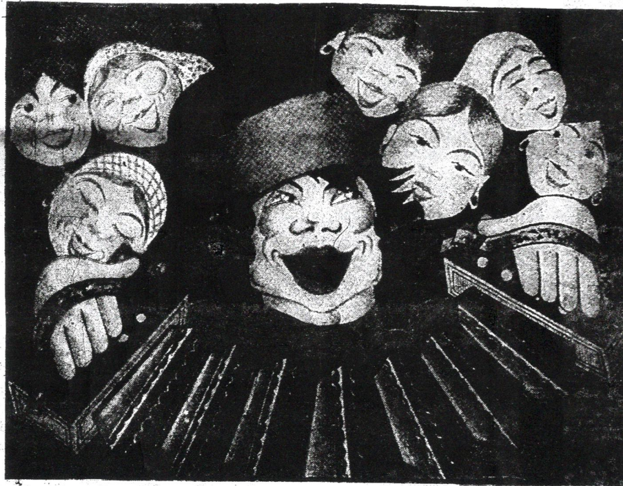
„Деревенскій соблазнитель“ — картина художника Леонида Годкевича. Многокрасочная репродукція „Сегодня“.

Гораздо болѣе откровенно звучитъ голосъ московскаго Коминтерна. Въ свѣдѣніи воззваніи отъ 18 июля это учрежденіе, столь тѣсно и неразрывно связанное съ совѣтскою властью, захлебывается отъ радости. Всеобщая забастовка, возстаніе, революционные массовые бои въ Вѣнѣ, въ Австріи, въ самой серединѣ Европы! Какъ боевой сигналъ воспринимаетъ это рабочіе всего міра и съ воодушевленіемъ и восторгомъ смотрятъ они на своихъ австрійскихъ братьевъ... «Исходъ борьбы отразится на судьбѣ рабочихъ всѣхъ странъ и на военныхъ планахъ империализма противъ СССР.» Коминтернъ не ограничивается только выраженіемъ своихъ чувствъ, но даетъ и «практическую» программу дѣйствій. «Не прекращайте забастовки и борьбы, пока вы не достигнете своихъ цѣлей! Необходимо продолжать всеобщую забастовку, пока не будетъ свергнуто правительство Зейделя... Добивайтесь вооруженія рабочихъ, разоруженія фашистскихъ организацій и полици, образованія рабочихъ совѣтовъ въ районахъ, въ вѣнскіхъ»