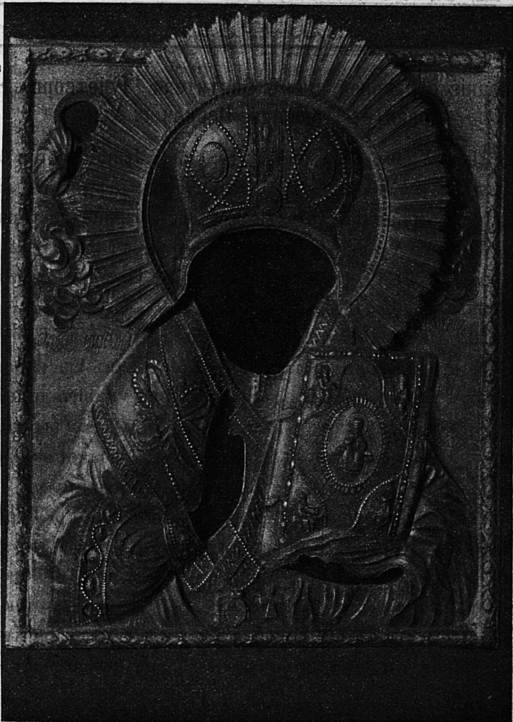
Древняя икона Святителя Чудотворца Николая, находящаяся въ Троицкой церкви г. Уфы.