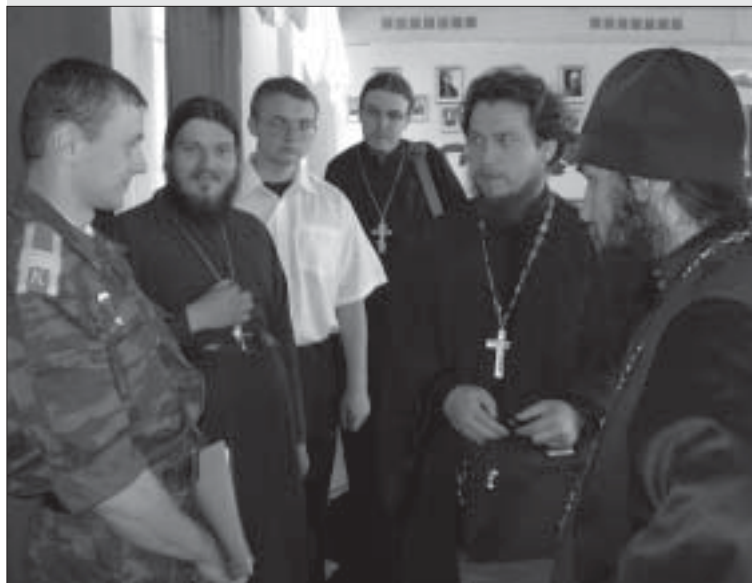
В перерыве между заседаниями