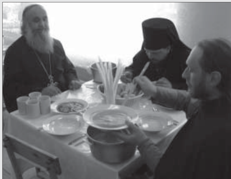
Священники обедают в курсантской столовой

Целью научно-практической конференции являлось обсуждение широкого круга вопросов, связанных с проблемой возрождения духовно-нравственных традиций в Русской армии и налаживания тесного сотрудничества между Рязанской Епархией, военными учебными организациями города Рязани и воинскими частями Рязанского гарнизона. Для участия в конференции были приглашены священнослужители, преподаватели и курсанты Военных ВУЗов, ответственные за воспитательную работу в учебных заведениях, научные работники, аспиранты и студенты ВУЗов. В рамках конференции состоялась работа трех секций: