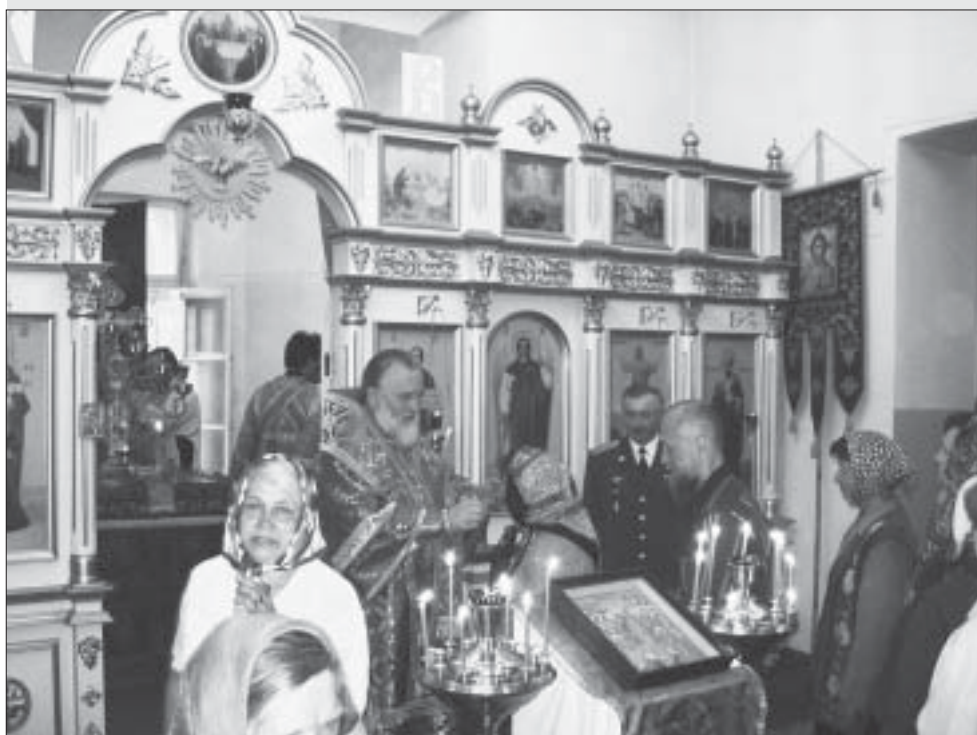
Божественная литургия в институтском храме «Воскресение Слоущее»