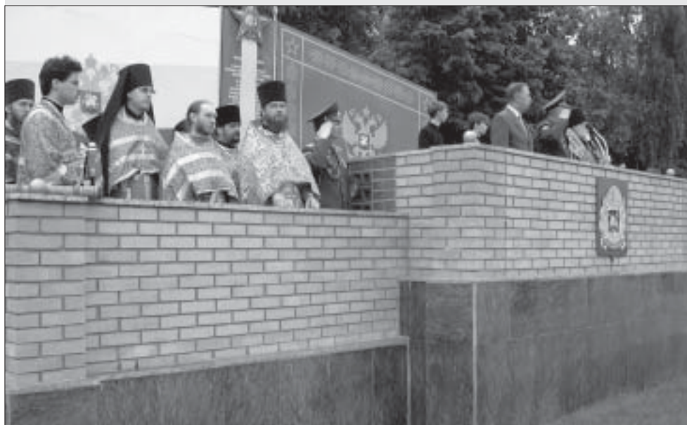
Начальник института в присутствии Владыки и священников принимает парад курсантов