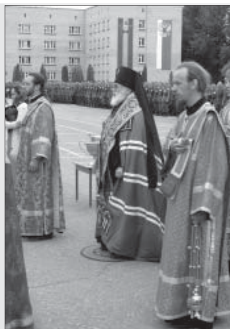
Во время молебна