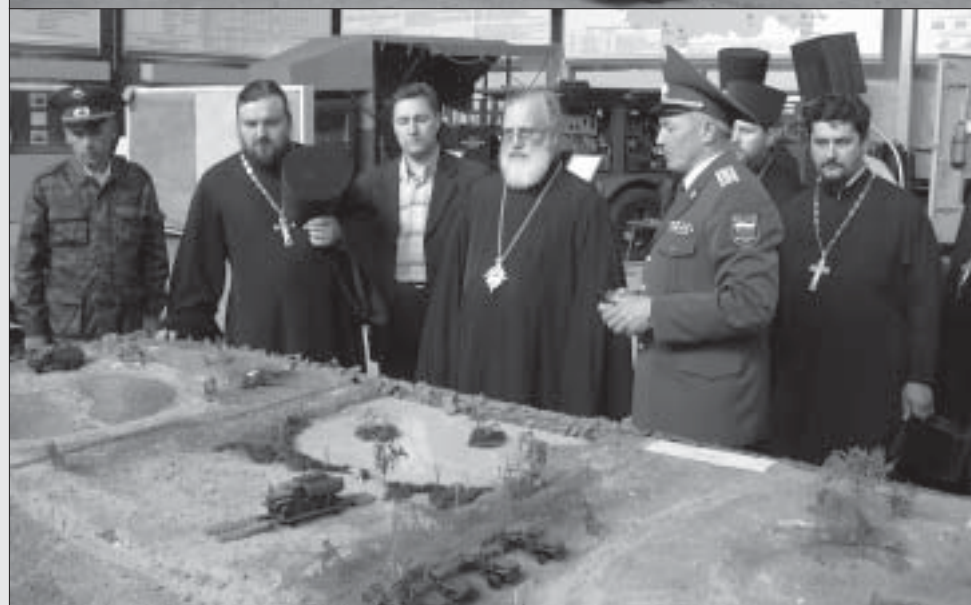
Осмотр музея военной автомобильной техники