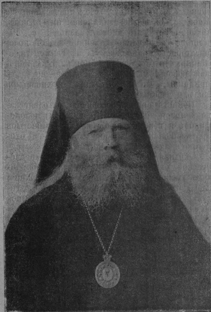
Михаилъ, Епископъ Минскій

Высочайшимъ указомъ, послѣдовавшимъ 5 мая 1904 года, Владыка сопричисленъ былъ къ ордену Св. Анны 1 степени.