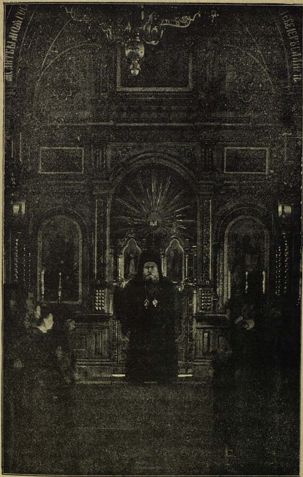
Высокопреосвященный Діонисій, архієпископъ острова Занте, въ миссійскомъ соборѣ въ Токио.