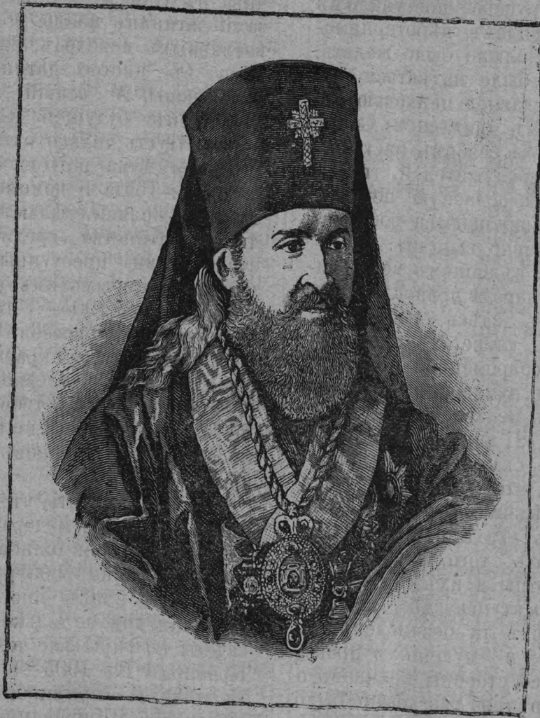
Высокопреосвященный Іосифъ Сѣмашко, Митрополитъ Литовскій и Виленскій. 1798—1868.

(По поводу 70-лѣтія воссоединенія униатовъ съ православною церковью).