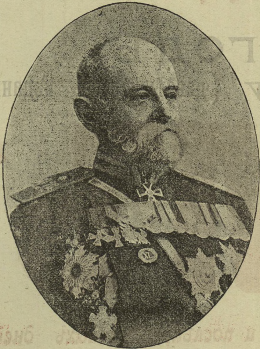
Командующий 1-й Манчжурской армией генерал-отъ-инфантеріи П. П. ЛИНЕВИЧЪ.