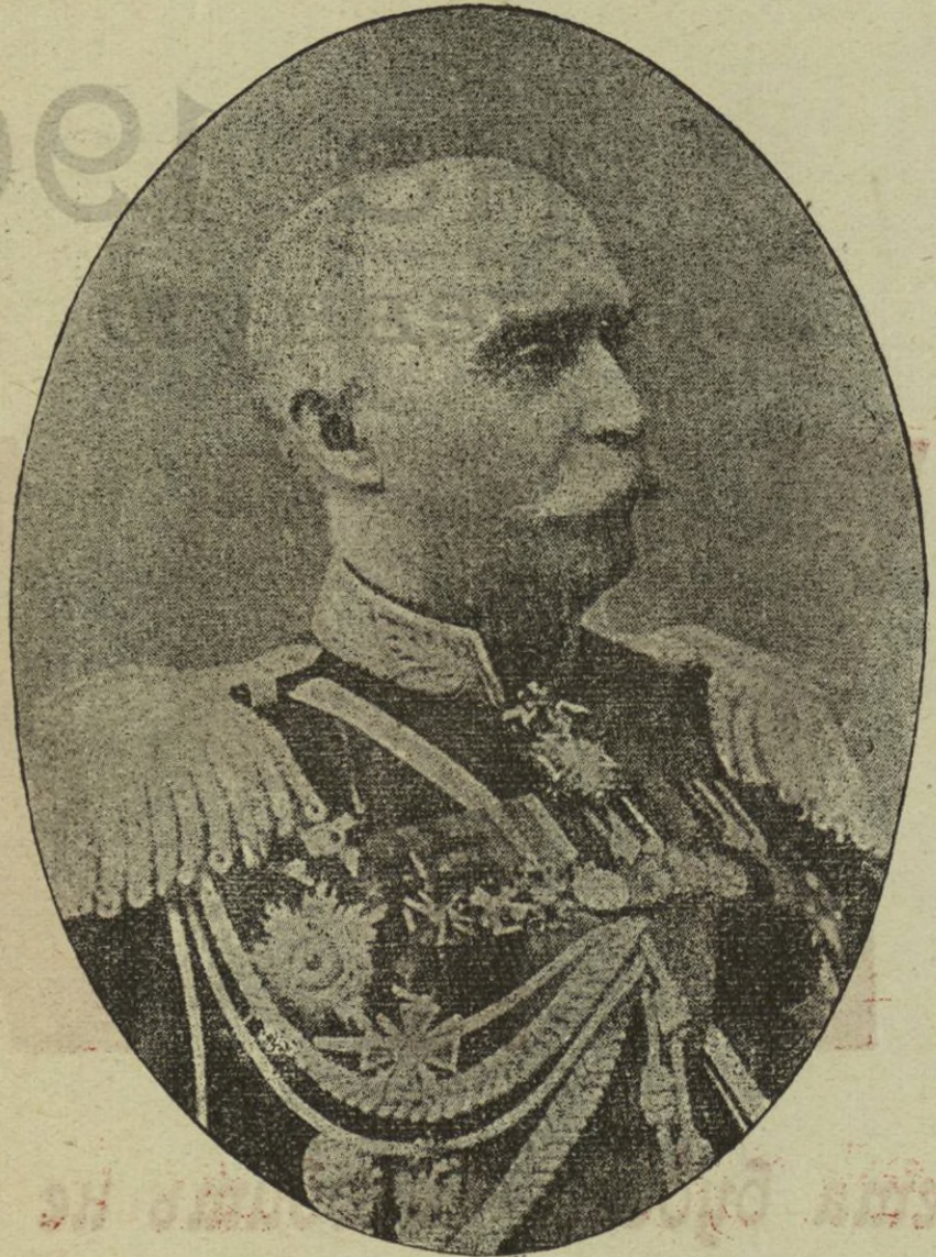
Командующий 3-й Манчжурской армией генералъ отъ-кавалеріи баронъ А. В. КАУЛЬБАРСЪ.