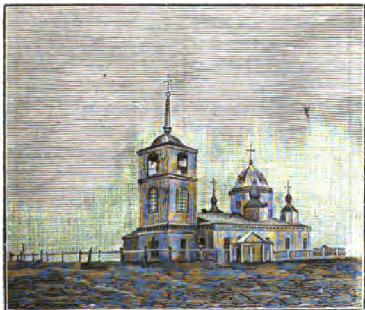
Преображенская церковь въ с. Пустоверскѣ.