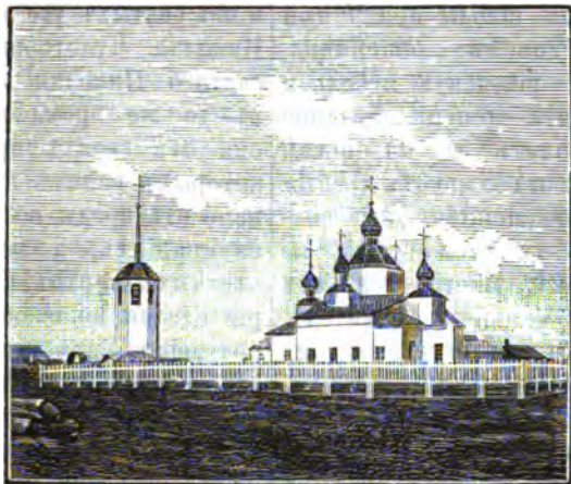
Церковь въ с. Оксинѣ, Пустоверской волости, на Печорѣ.