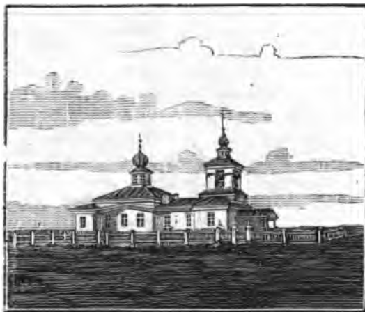
Самоѣдская Тельвисочная Богоявленская церк.

Упомянувъ о самоѣдахъ, позволю себѣ сообщить здѣсь нѣкоторыя свѣдѣнія о ихъ вѣрованіяхъ, по поводу найденной мною, вблизи Пустозерскаго селенія, коллекции самоѣдскихъ идоловъ, а также по поводу посѣщеннаго мною мѣста совершенія жертвоприношеній язычествующихъ самоѣдцовъ.—Православные самоѣды искренно исповѣдуютъ Бога христианскаго и изъ святыхъ угодниковъ особенно чтутъ Николая Чудотворца, признавая Бога и святаго Николая за начало свѣтлое; но въ то же время не могутъ отрѣшиться ни отъ своихъ прежнихъ божествъ, въ которыхъ видятъ начало злое, способное наносить вредъ во всѣхъ ихъ дѣлахъ и начинаніяхъ, а потому требующее извѣстныхъ жертвъ. Остатки такого двоевѣрія едва ли не извинительны для народа, кочующаго въ тундрахъ и зависящаго отъ массы случайностей крупныхъ и мелкихъ, благоприятныхъ и неблагоприятныхъ, которыя и истолковываются ими по своему разумію, конечно, еще далеко не достигшему желательной высоты. Не-