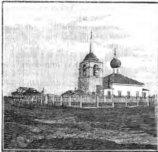
Церковь въ с. Кую, Пустозерской волости.

и къ Введенію Пречистыя да къ Николѣ Чудотворцу въ домъ, да и грамота будетъ у священниковъ тѣхъ престоловъ наша жалованная на тое мѣсто тою есть и тое мѣсто тою выдають священники тѣхъ престоловъ къ Преображенію Спасову и къ Пречистой Введенію и къ Николѣ Чудотворцу въ домъ“ и т. д. И такъ отсюда уже видно, что въ 1545 году существовало въ Пустозерскѣ три указанныхъ въ грамотѣ престоловъ. Въ XVII и XVIII столѣтіяхъ благочестіе, надо думать, также процвѣтало въ Пустозерскѣ; въ это время, по свѣдѣніямъ церковнаго архива, было тамъ построено 5 церквей: въ 1600 годахъ построена придѣльная церковь во имя святыхъ Аванасія и Кирилла святителей Александрійскихъ; въ 1686 году, по благословенію Аванасія, перваго архіепископа Архангелогородскаго, построена Преображенская церковь; въ 1706 году воздвигнуть храмъ во имя святаго великомученика Георгія; въ 1734 году, по благословенію епископа Германа, воздвигнута церковь Введенія Пресвятой Богородицы и, наконецъ, въ 1780 году— во имя святаго Николая Чудотворца; изъ нихъ церкви во имя Аванасія и Кирилла, а также Преображенская и Введенская со временемъ упразднены за ветхостью; Никольская церковь сгорѣла въ 1885 г., а храмъ во имя святаго великомученика Георгія перенесенъ въ село Кую, той же волости. Въ настоящее время въ Пустозерскомъ селеніи существуетъ одна Преображенская церковь, построенная въ 1835—37 гг.; храмъ довольно видный и небѣдный, обла-