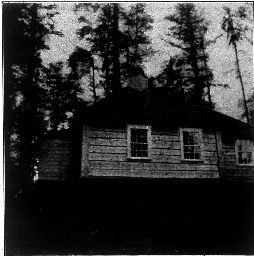
Часовня на могилѣ старца Германа на островѣ «Еловомъ» (къ ст. «На трехъ островахъ»).

Вскорѣ пароходъ остановился у пристани и Владыка направился въ церковь, которая уже наполнилась народомъ. Не было только дѣтей, находившихся въ это время въ правительственной школѣ, а потому составъ хора вышелъ совершенно случайный. Состоялась встрѣча, положенная по уставу въ подобныхъ случаяхъ, въ концѣ которой Преосвященнымъ было произнесено поученіе о необходимости ро въсѣхъ