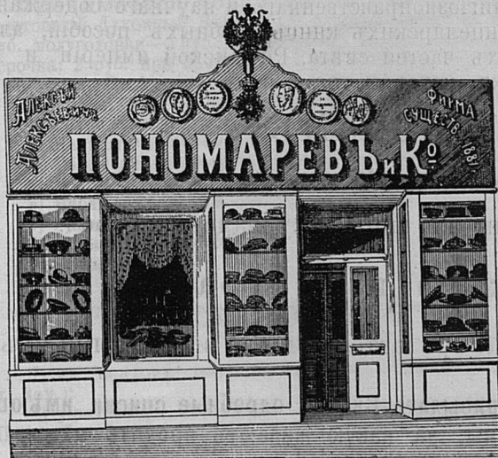
Саратовъ, Никольск. ул. д. Лютеранской церкви.

Принимаются ЗАКАЗЫ на Камилавки и Скуфьи.