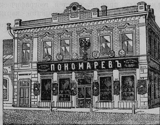
Самара, Дворянская ул. д. Лютеранской церкви.

Принимаются ЗАКАЗЫ на Камилавки и Скуфьи.