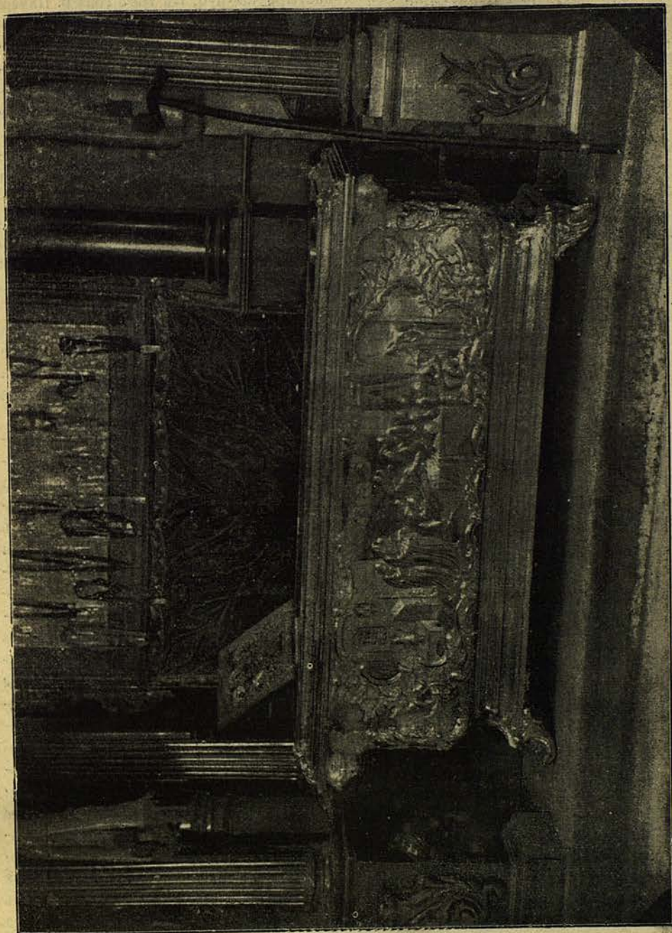
Гавъ съ святыми мощами преподобнаго Антонія Сійскаго чудотворца.