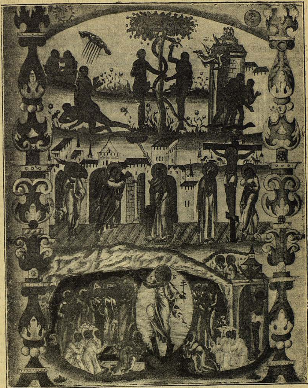
Мѣсяць мартъ по церковнымъ преданіямъ (изъ Сійскаго Евангелія).