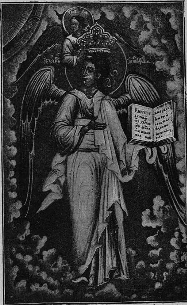
Евангелистъ Матеей (изъ Сійскаго Евангелія).

Псалтирь толковая также заслуживаетъ вниманія. Здѣсь письмо отчасти полууставное и съ кинжальными началами, но далеко уступающее Евангелію сему и даже несравнимое съ нимъ. Еще того бѣднѣе письмо хронографовъ, гдѣ оно переходитъ иногда въ скоропись. Въ нѣкоторыхъ изъ послѣднихъ