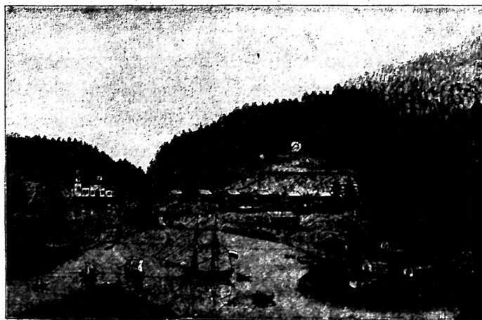
Г Видъ на о. Кадьякъ.