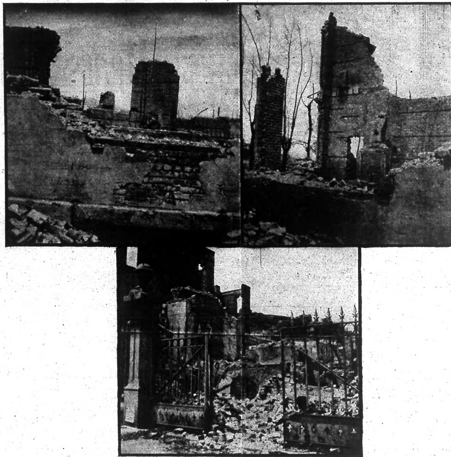
Развалины С. Франциск. Собора, послѣ землетрясенія и пожара.

Поддержите же насъ, добрые люди! Поддержите своей посильною лептою. Вашимъ усердіемъ воздвигнуты храмы Божіи во всѣхъ концахъ православнаго міра. Вашимъ усердіемъ содержатся они въ благолѣпіи и красотѣ. Будете жертвовать вы и впредь. Не обойдите же и насъ