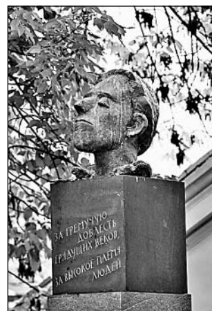
Памятник Мандельштаму на ул. Забелина