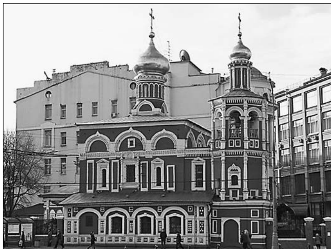
Церковь Всех святых на Кулишках