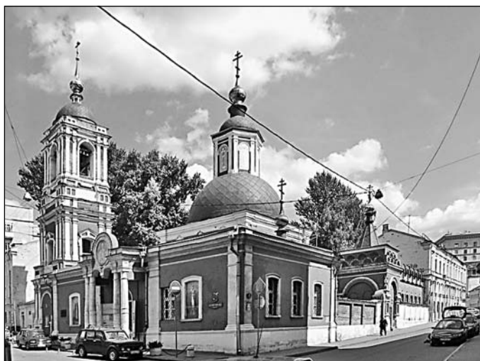
Церковь Свт. Николая в Подкопаев