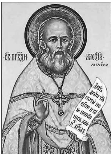
Свт. Алексий Мечёв

много. Но мы ограничимся небольшим пространством и несколькими человеческими судьбами.