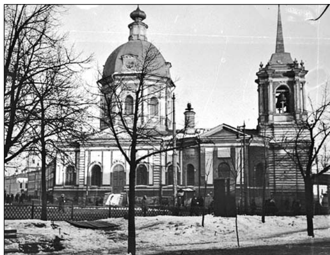
Церковь Свв. мчч., бесср. и чудотворцев Кира и Иоанна (снесена)

Ответом на этот вопрос стали жизнь, смерть и слово самого Осипа Мандельштама. Поэту суждено