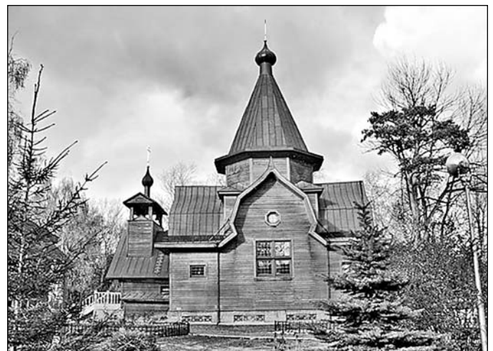
Церковь Свт. Николая у Соломенной Сторожки