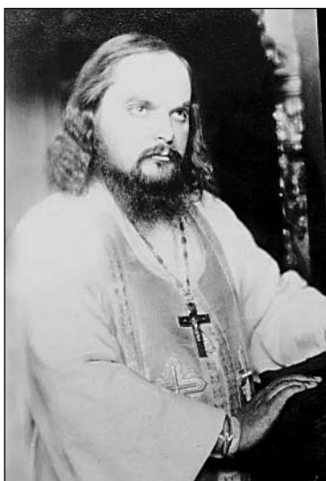
Сщмч. Сергей Мечёв

Ивановская горка и её окрестности полны живой памяти о мучениках и исповедниках веры XX в. Сердцем московской православной жизни в 1920-е гг. стала церковь Свт. Николая в Кленниках на Маросейке. Её общину создал св. прав. старец Алексий Мечёв. После его смерти в 1923 г. общину возглавил сын,