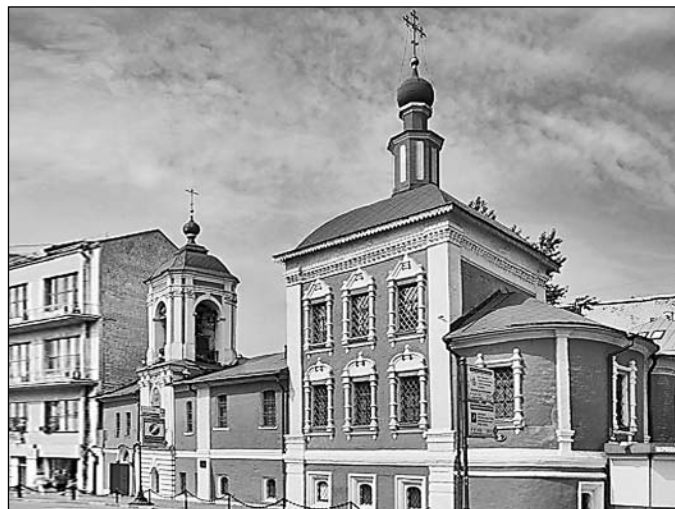
Церковь Свт. Николая в Кленниках на Маросейке