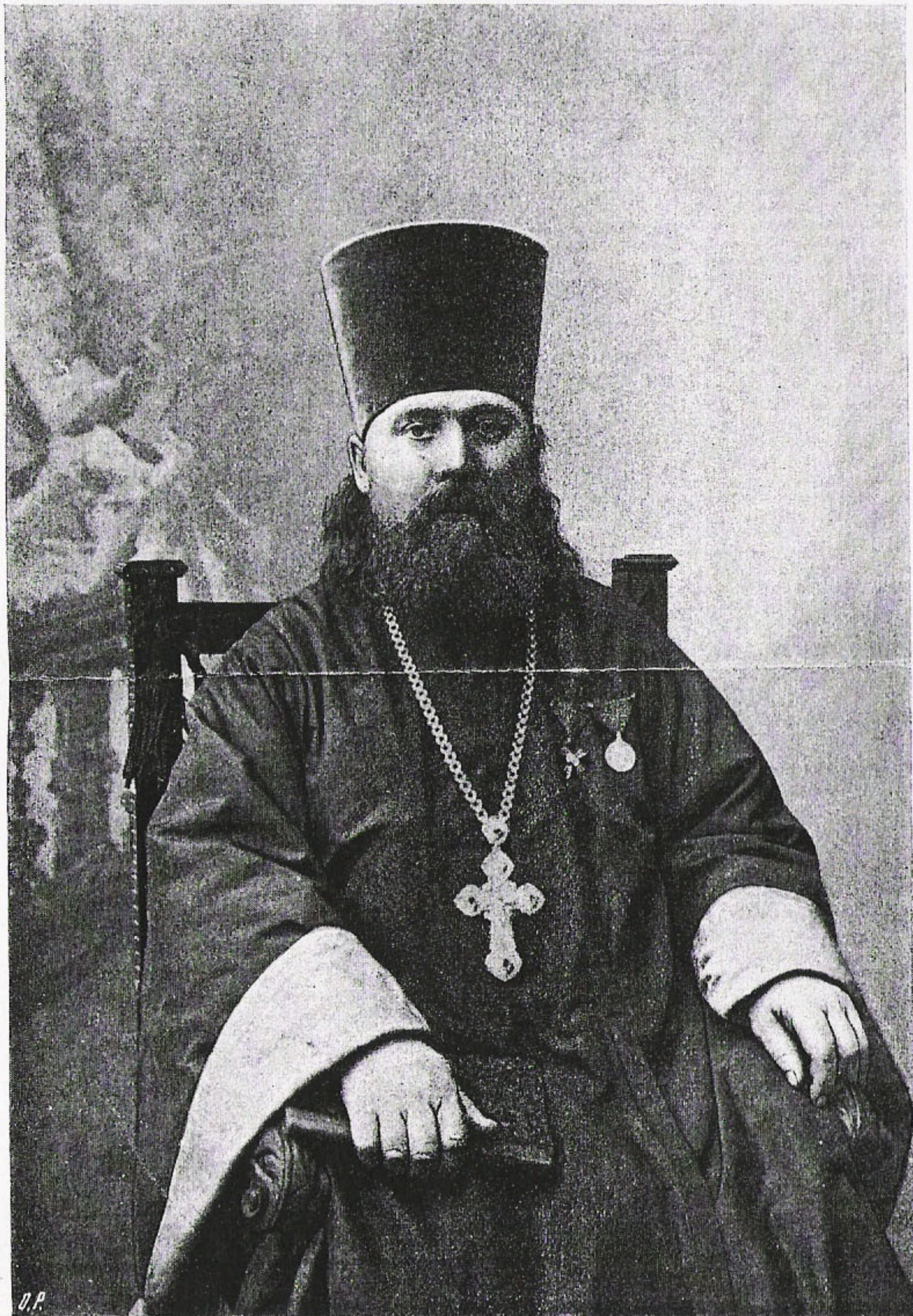
ПРОТОІЕРЕЙ Василій Григорьевичъ ТОЛГСКІЙ.