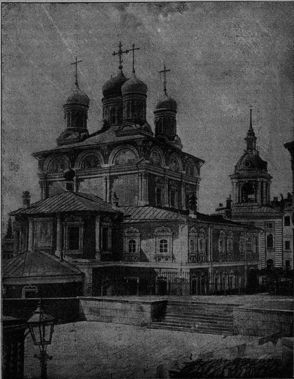
Видъ Знаменскаго монастыря въ Москвѣ.

діаконъ Орестъ, діаконъ Іоаннъ, монахъ Мееодій, послушникъ Тимофей Васильевъ остались въ монастырѣ съ двумя служителями до нашествія въ Москву непріа-