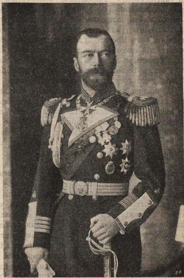
ЕГО ИМПЕРАТОРСКОЕ ВЕЛИЧЕСТВО ГОСУДАРЬ ИМПЕРАТОРЪ НИКОЛАЙ АЛЕКСАНДРОВИЧЪ.

мановъ, оказаль огромныя услуги государству, заплативъ тяжельмъ плѣномъ за хрѣпкое стояніе за Русь подъ Смоленскомъ. „Патріархъ у насъ начальный челоувѣкъ теперь, когда мы без-