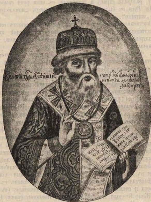
Святѣйшій патриархъ Филаретъ.

тельства и шестичасовой бесѣды съ посольствомъ—Ипатьевскій монастырь въ Костромѣ и монастырскій соборъ; самъ Михаилъ ѣдетъ прежде всего для говѣнія въ Лавру, оттуда въ Москву и здѣсь его встрѣчаютъ по-церковному съ крестами и хоругвями, ведутъ въ Успенскій Соборъ и заключаютъ коронованіемъ въ томъ же Соборѣ—въ іюнѣ 1613 г. Около него мать — монахиня