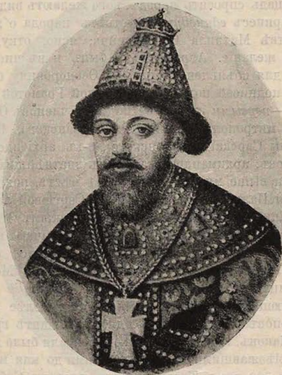
Царь Михаилъ Теодоровичъ Романовъ.

ликій Земскій Соборъ для избранія царя, то во главѣ Земскаго Собора сталъ Освященный Соборъ; Троицкое подворье, или Бого-явленскій монастырь въ Кремлѣ (впослѣдствіи упраздненный; даже зданій подворья, къ сожалѣнію, не осталось),—сдѣлалось центромъ выборной борьбы. А борьба была. Какъ только рѣшено было избрать природнаго русскаго государя, тотчасъ образова-