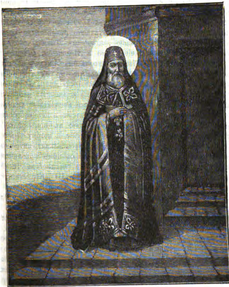
Пресвященный Симоонъ, митрополитъ Смоленскій.

Въ 1682 году Симоонъ участвовалъ въ совершеніи хиротоніи святителя Митрофана. Вся эта широковліятельная дѣятельность митрополита Симоона нѣкоторыми объясняется его особою близостію къ царю, имѣвшему