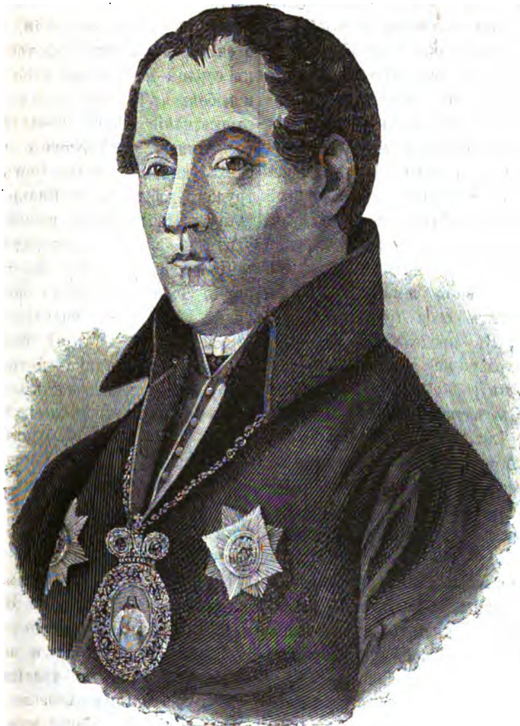
Іосифъ (Сѣмашко), униатскій епископъ.

Въ сентябрѣ 1809 г. Іосифъ Сѣмашко поступилъ въ Немировскую гимназію, Каменецъ-Подольской губерніи. Благодаря своимъ способностямъ и значительнымъ познаніямъ, приобретеннымъ въ домѣ родителей, Іосифъ оказался здѣсь въ числѣ первыхъ учениковъ. Въ Немировской