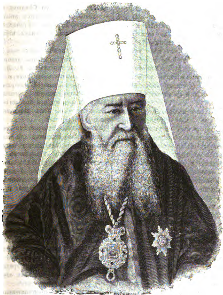
Иосифъ (Самашо), православный митрополитъ Литовскій и Виленскій.

Между тѣмъ въ 1823 году (23 марта) онъ былъ произведенъ въ каноники, а въ 1825 г. (8 октября)—въ санъ прелата-схоласта Луцкаго униатскаго кафедральнаго капитула, а епископъ Мартусевичъ избралъ