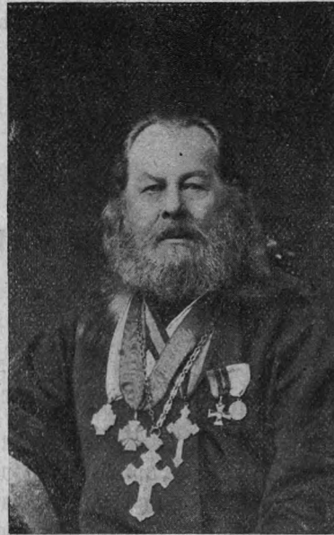
Протоіерей Петръ Алексѣевичъ Соловьевъ (1885—1898 гг.).

Прошло 50 лѣтъ со времени перваго расширенія храма, и снова Церковь оказалась