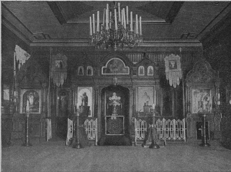
Внутренній видъ Тихвинской Церкви, что при дѣтской санаторіи Покровскаго Бл. Общества, у ст. „Сиверской“ С.-З. ж. дор.

знать, что любовь прихожанъ къ своей родной церкви теперь такъ же горяча, какъ и встарь. Благому примѣру отцовъ слѣдуютъ дѣти и свою преданность Покрову Божіей Матери выражаютъ заботами о благолѣпіи храма, посвященнаго Ея св. Имени.