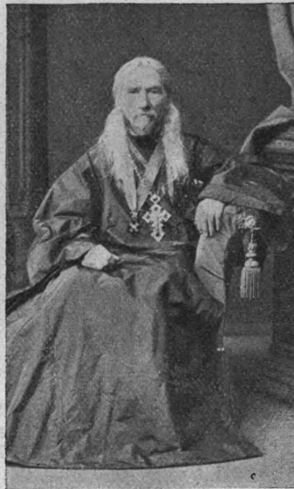
Протоіерей Теодоръ Іовлевичъ Іовлевъ (1860—1879 гг.).