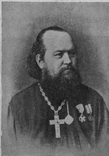
Протоіерей Іоаннъ Александровичъ Горскій (1882—1885 гг.).