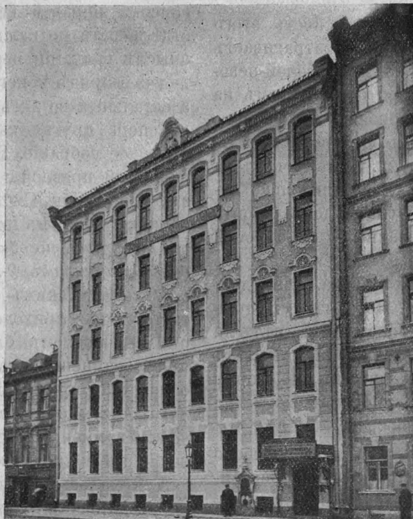
Домъ Покровскаго Благотворительнаго Общества (Садовая, № 104).