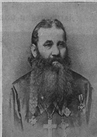
Протоіерей Василій Стахѣевичъ Княжинскій (1879—1882 гг.).