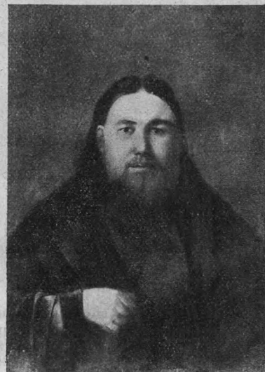
Протоіерей Григорій Алексѣевичъ Добротворскій (1855—1860 гг.).

освященіе главнаго алтаря было совершено митрополитомъ Никаноромъ 30 сентября, т. е.