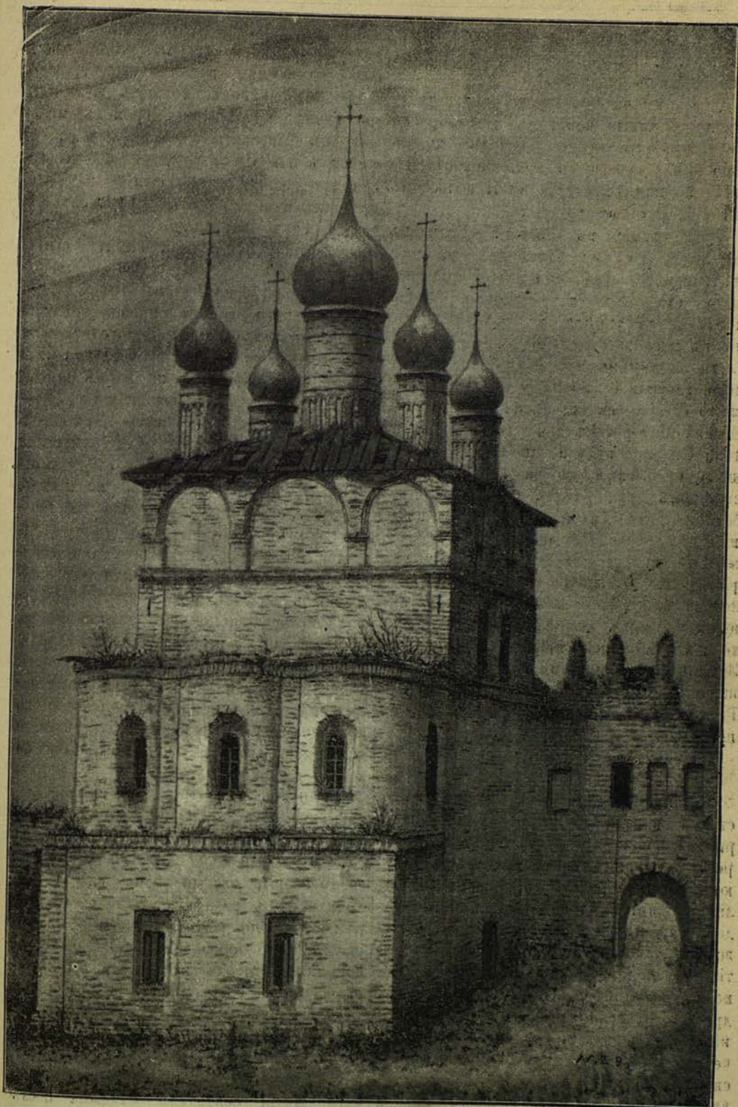
Видъ Григорьевской церкви въ Ростовскомъ кремлѣ въ 40-хъ годахъ настоящаго столѣтія.