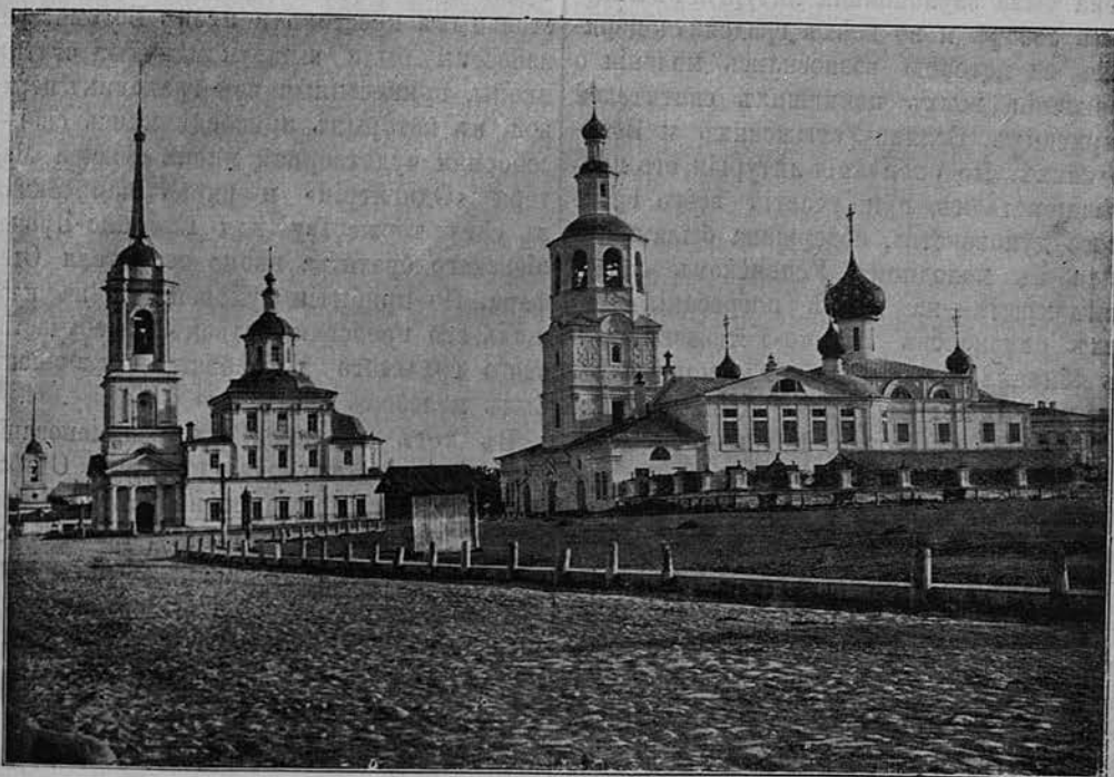
Церковь Всемиловитиваго Спаса (обыденная).

Члены комисіи по устройству празднованія 500-лѣтія кончины святителя Стефана, подъ предсѣдательствомъ о. ректора Вологодской духовной семинаріи архимандрита Василія, старательно и съ любовью отнеслись къ устройству празд-