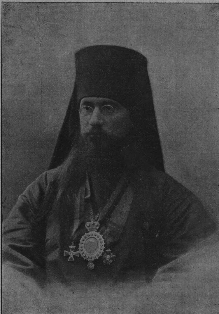
Преосвященный Евлогій, Епископъ Холмскій, Товарищъ Предсѣдателя Виленскаго Братскаго Съѣзда, Членъ Государственной Думы.