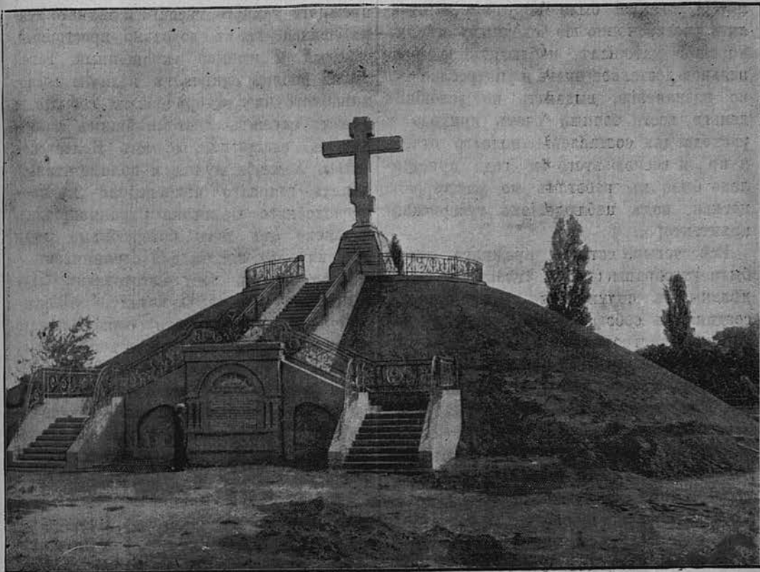
Новый памятникъ на Шведской могилѣ.

Сампсоніевской церкви. Въ этомъ же году, 25 августа, Шведскую могилу посѣтилъ Г. Оберъ-Прокуроръ Святѣйшаго Синода К. П. Побѣдоносцевъ. Лично ознакомившись съ ея жалкимъ, запущеннымъ состояніемъ, непосредственно увидѣвши крайнюю бѣдность и малую вмѣстительность Сампсоніевской церкви, Г. Оберъ-Прокуроръ тогда же принялъ рѣшеніе—обновить памятникъ на могилѣ и замѣнить прежній деревянный крестъ но-