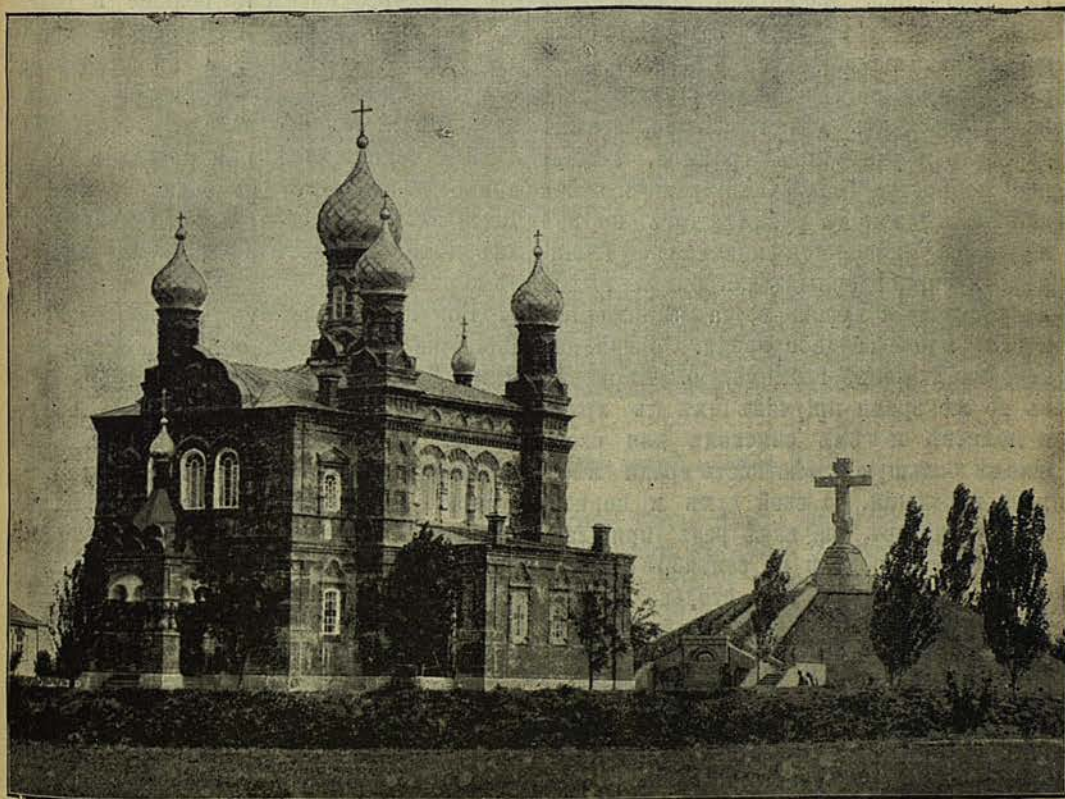
Видъ новоустроенной Самсоніевской церкви на полѣ Полтавской битвы.