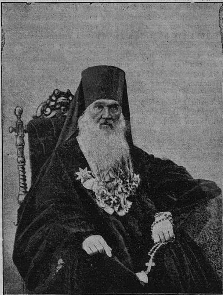
Пресвященный Иларіонъ, епископъ Полтавскій и Переяславскій.

Ихъ Императорскихъ Величествъ, зеленою и флагами. Подножіе памятника было декорировано транспарантами, на которыхъ были изображены вензеля нынѣ благополучно царствующаго Государя Императора, Царя-Миротворца и Царя-Преобразователя Россіи. На наружной стѣнѣ Сампсоніевского храма, сооруженнаго около Швед-