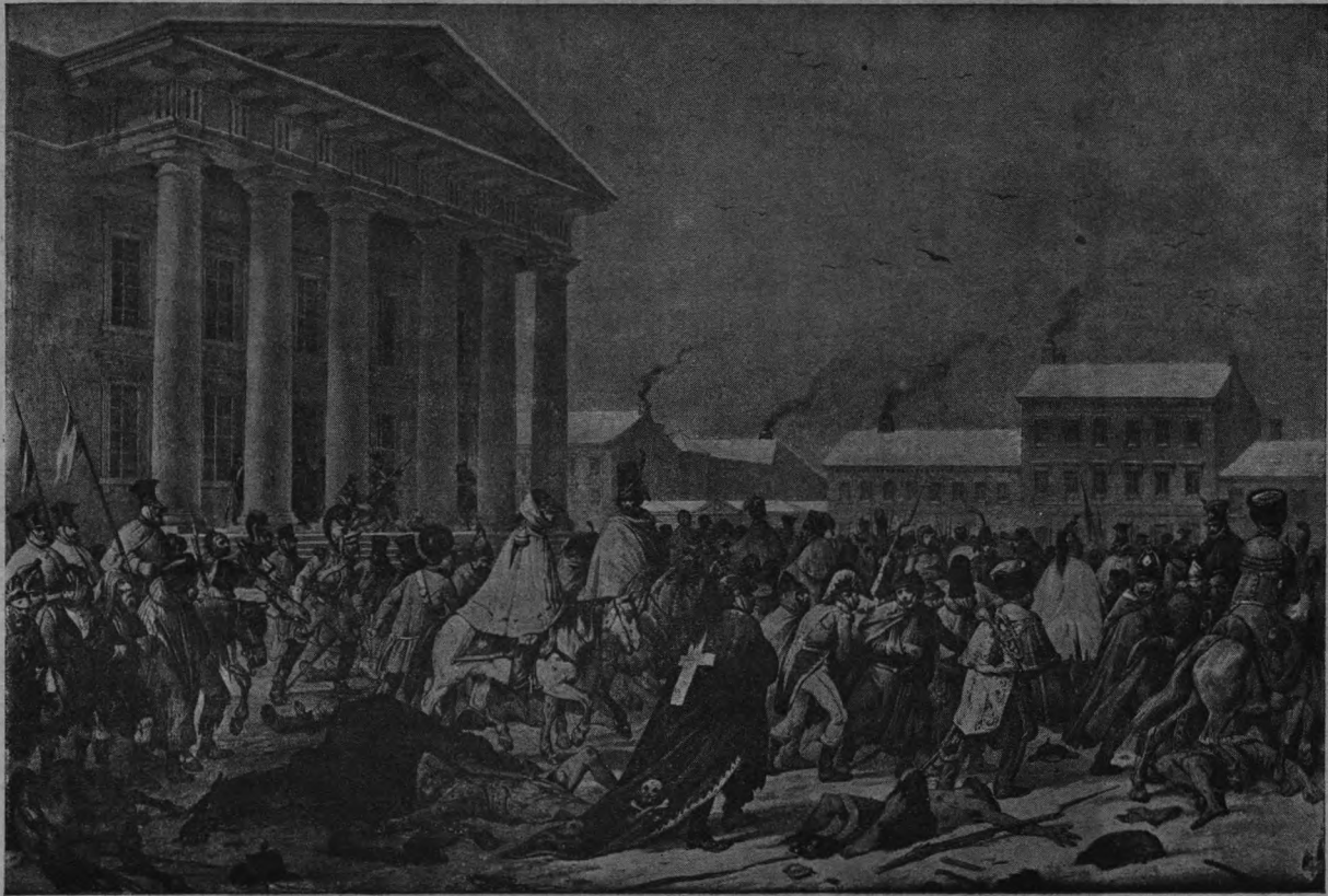
Отступленіе французск. арміи черезъ Вильну 22—23 ноября 1812 г.

Ровно въ 12 ч. дня Высокопреосвященнѣйшій Агафангелъ совершилъ благодарственное молебствіе за избавленіе Россіи отъ нашествія дванадцати языкъ. Послѣ царскаго многолѣтія была возгласена „вѣчная память“ павшимъ въ Отечественную войну вождямъ и войнамъ. Поле огла-