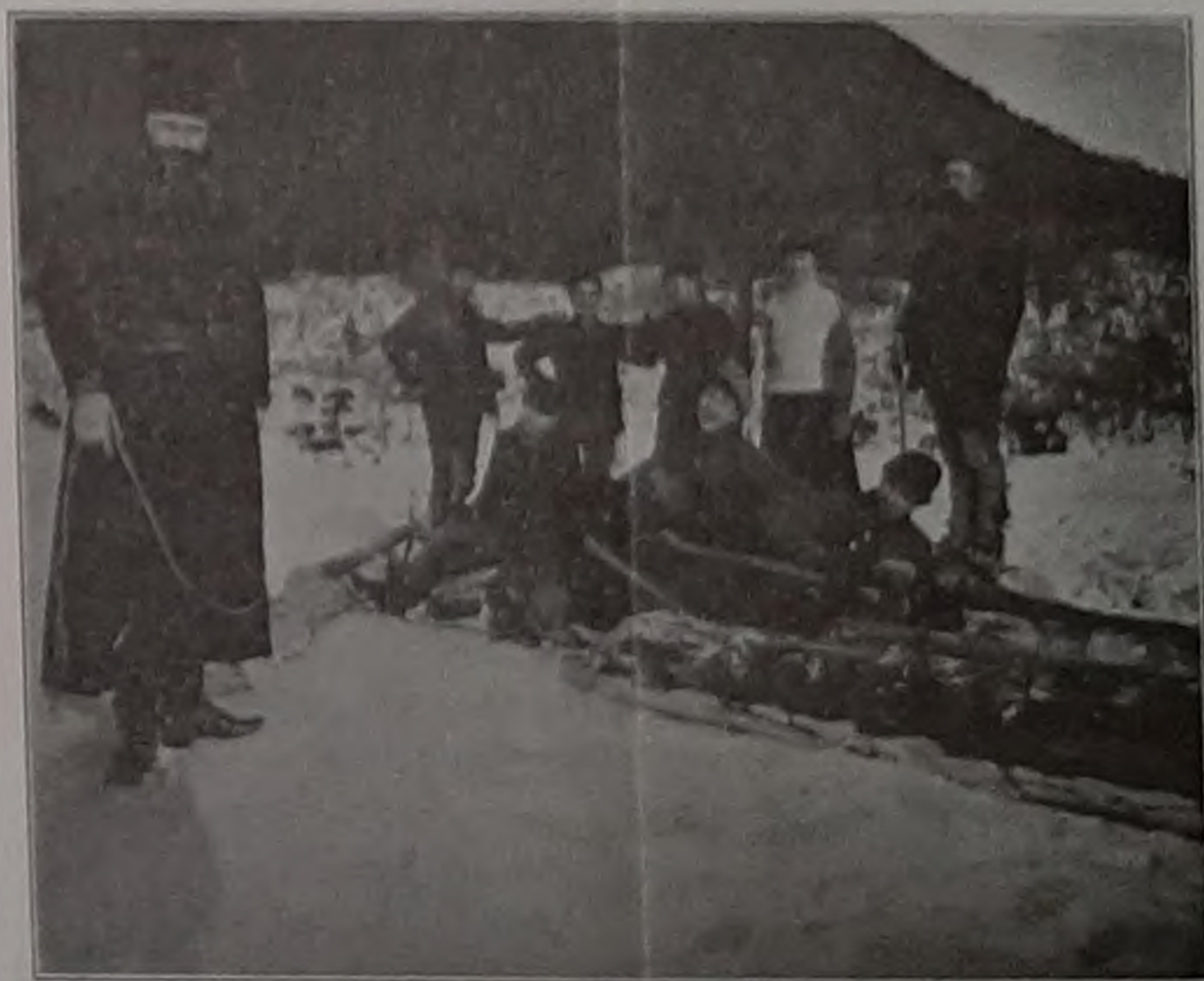
Ситкинскіе семинаристы съ дровами (въ отчету по Аляск. Вѣк. за 1907 г.)