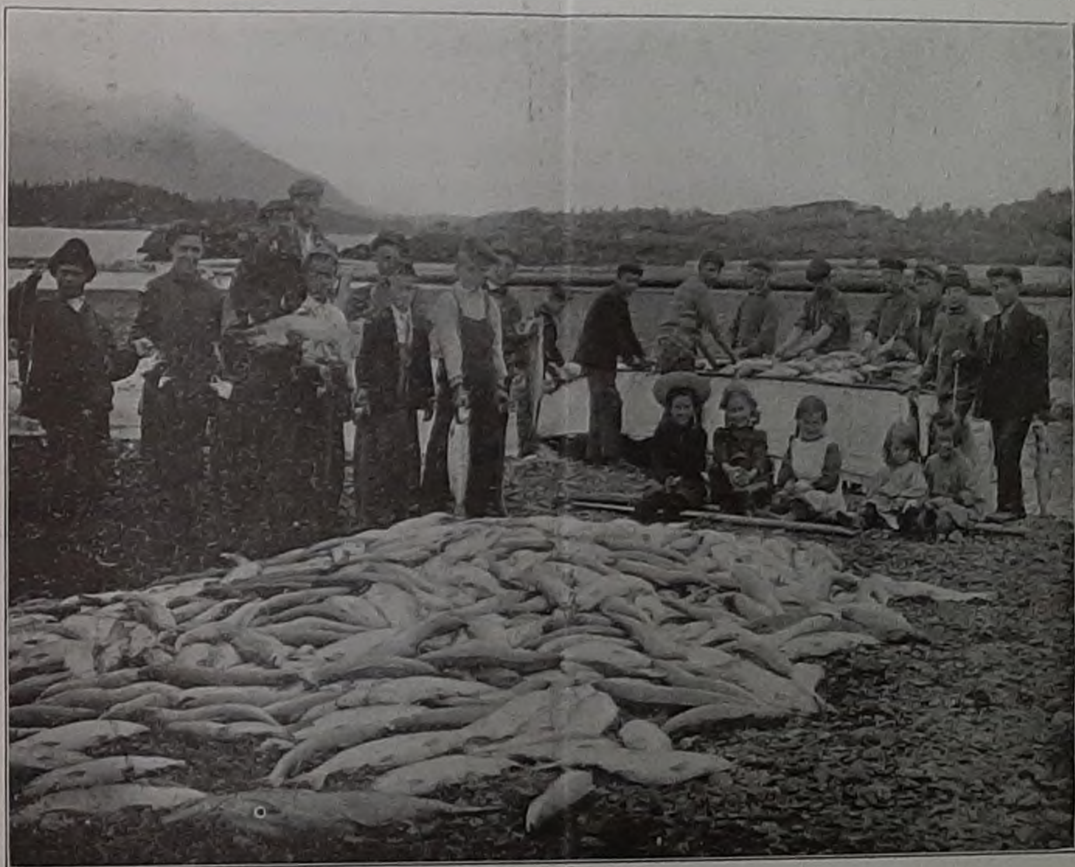
Ситкинскіе воспитанники на рыбной ловлѣ (къ отчету по Аляск. Бюк. за 1907 г.).

ляли для отопленія, или на другія надобности, избѣгая такимъ образомъ весьма серьезныхъ расходовъ. Костюмы цѣлыми партиями выписывали изъ Санъ-Франциско, бѣлье — изъ Чикаго, вездѣ получая громадную скидку и гораздо лучшей товаръ, чѣмъ на мѣстѣ.