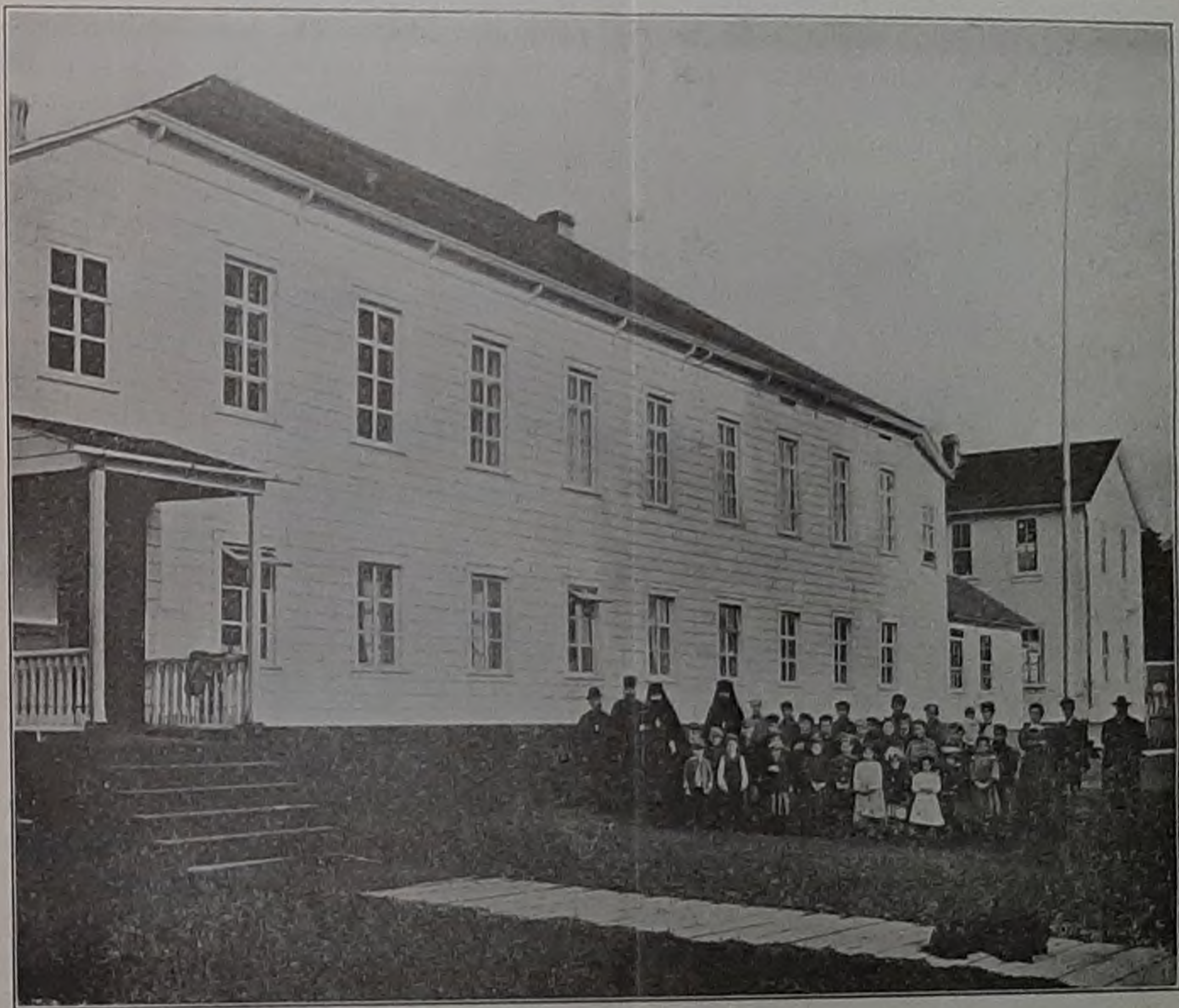
Ситкинская Семинарія (къ отчету по Аляск. Вѣк. за 1907 г.)

оказался доступнымъ для молодыхъ людей, неимѣющихъ никакой подготовки къ изученію Основнаго Богословія, гдѣ есть и спеціальныя выраженія и философскіе термины, непонятные для новичковъ. Итакъ въ концѣ учебнаго года воспитанники вполне усвоили предметъ. Это видно по письменнымъ работамъ ихъ (последнее