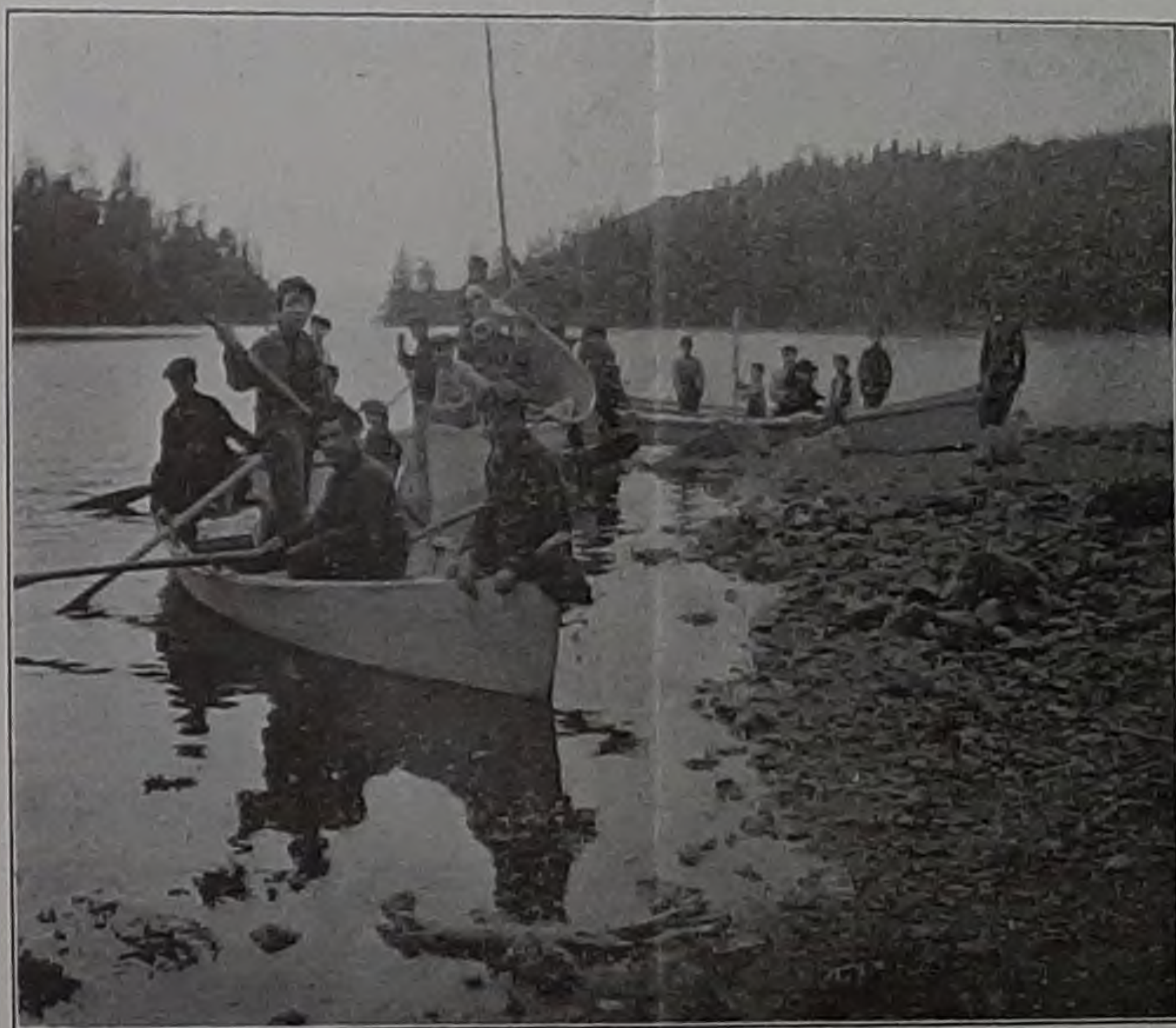
Ситкинскіе воспитанники на рыбной ловлѣ (къ отчету по Аляск. Вик. за 1907 г.)

По Священной Исторіи въ старшемъ классѣ пройдена исторія Нового Завѣта. Въ младшемъ классѣ исторія Ветхаго Завѣта. Дѣтямъ, не понимающимъ по русски, уроки объяснялись на англійскомъ или колонинскомъ языкѣ. Также и молит-