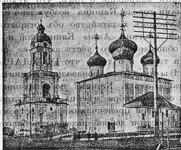
Тверской кафедральный соборъ.